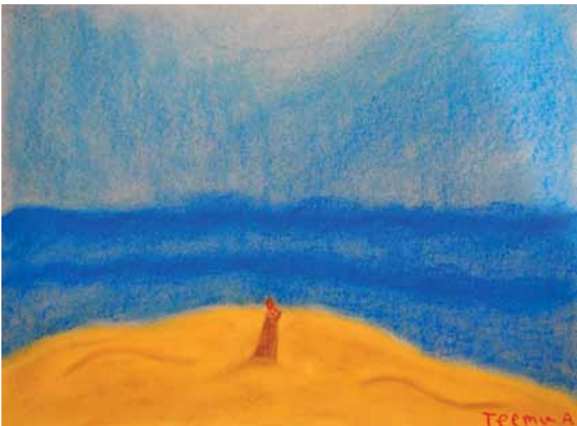
Teemu A. lukion 2. lk