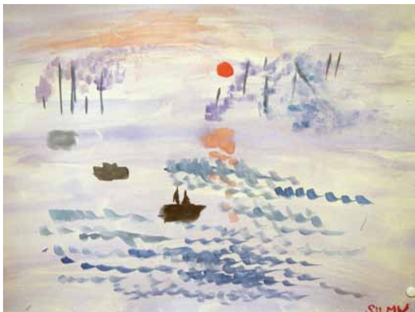
Silmu lukion 4. lk