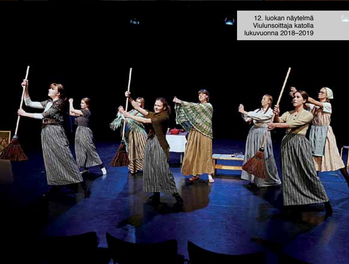
12. luokan näytelmä Viulunsoittaja katolla lukuvuonna 2018–2019