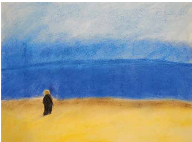
Petja lukion 2. lk