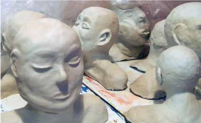
Savesta muovailut päät, lukion 3. lk