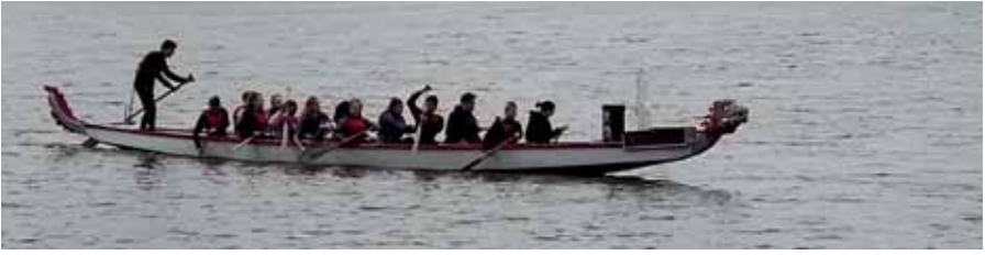
Lukion 1.lk ensimmäisellä kouluviikolla lohikäärmemelonnassa.

paaminen näin lukion alussa on ollut kiva ja myös jännittä asia, sillä tulee mieleen asiat kenen kanssa tulen toimeen vai tulenko kenenkään kanssa ja minkälainen luokkahenki tulee olemaan, mutta näyttää siltä että ihan turhaan tämä on mietityttänny.