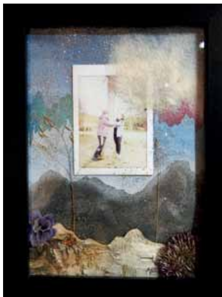
Lapinleirillä tehty taulu, parityö, lukion 1. lk

Lukion aloittaminen tuntui vapautavalta ja oudolta samaan aikaan. Tämä varmaankin johtuu siitä, että sai ensimmäistä kertaa valita mitä aikoo opiskella, eikä vaan mitä lukujärjestyksessä lukee. Tämä vapaus tuo myös vastuun siitä että saat hommat hoidettua ja kurssit suoritettua ja se on jo nyt saanut välillä stressin nousemaan. Uusien ihmisten ta-