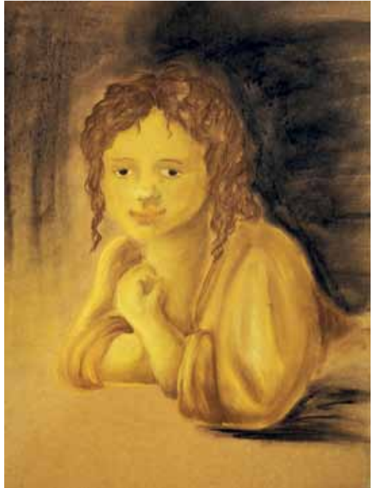
Jade lukion 1. lk