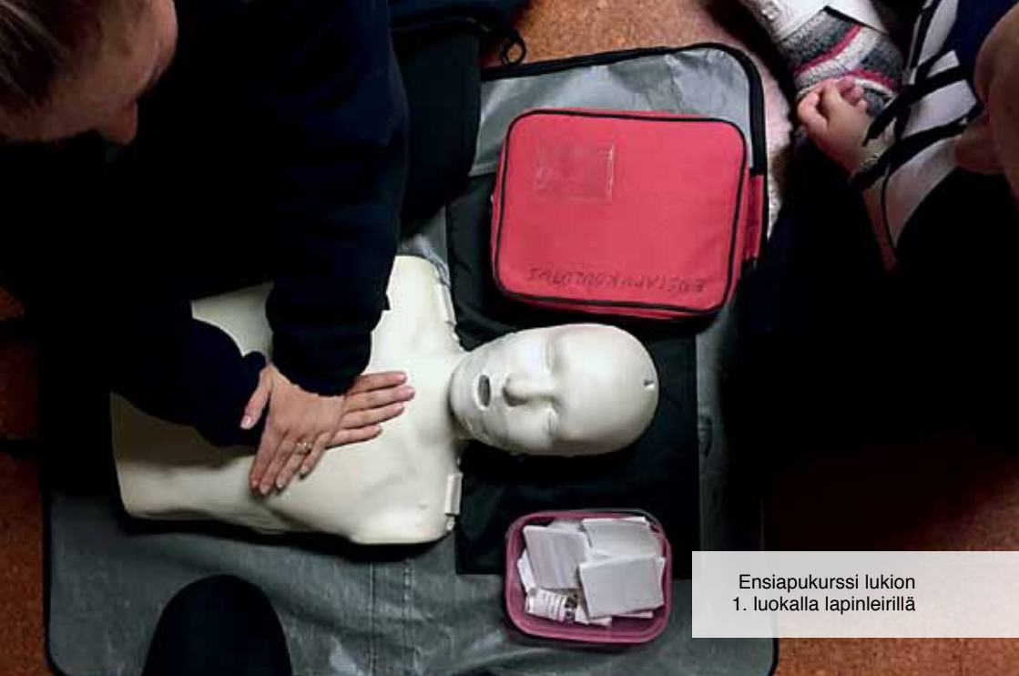
Ensiapukurssi lukion 1. luokalla lapinleirillä