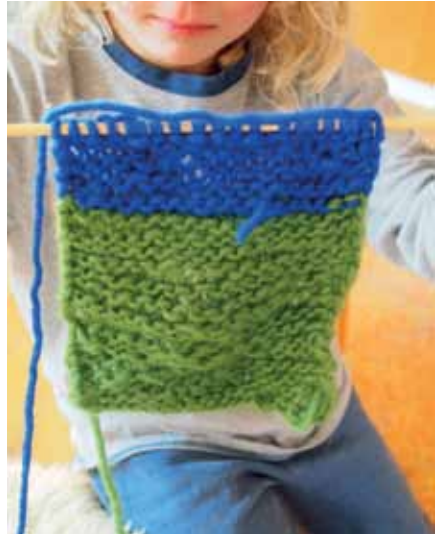
Pannulappu valmistuu neulomalla 1.lk

Samoin teknisen käsityön luokassa työskentely on ollut paneutunutta erityisesti kun viidesluokkalaiset ovat voulleet persoonallisia voiveitsiään ja kuudesluokkalaiset kovertaneet puuastioita taltalla ihan hiki päässä.