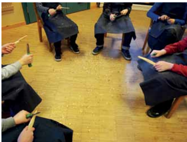
5.lk voiveitsien vuoleminen