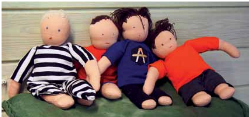
6.luokkalaisten ompelemia persoonallisia nukkeja

Kun meidän luokka alkoi tehdä nukkeja sain idean, että entä jos tekisin nukelle haarniskan. Idean sain siitä, kun olin