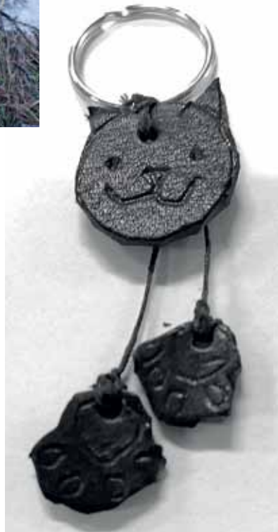
nahka-avaimenperä, Minttu 9.Ik