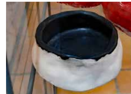
▲ Hannaliisan saviastia