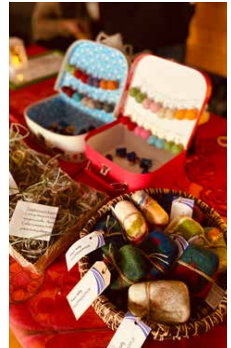
▲ kuvat Jenni Kokander