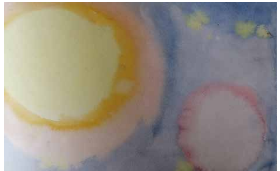
▲ Sante 3. lk