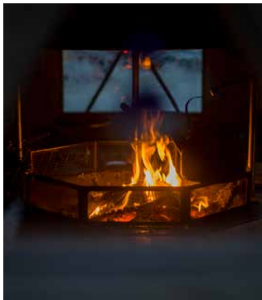
▲ Kuva Ville Luonuansuu