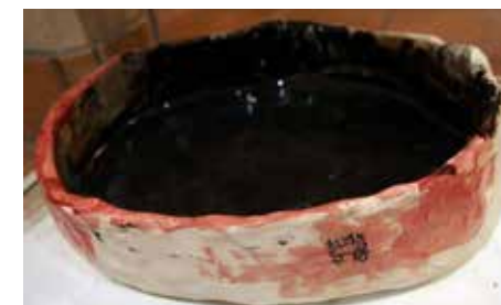
▲ Timofein saviastia