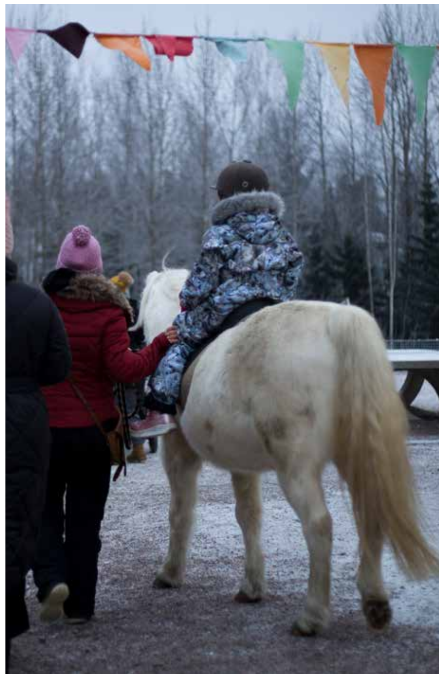
▲ kuva Ville Luonuansuu