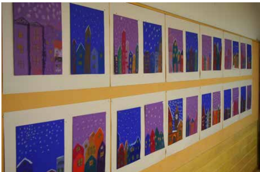
▲ 5 luokan piirustuksia