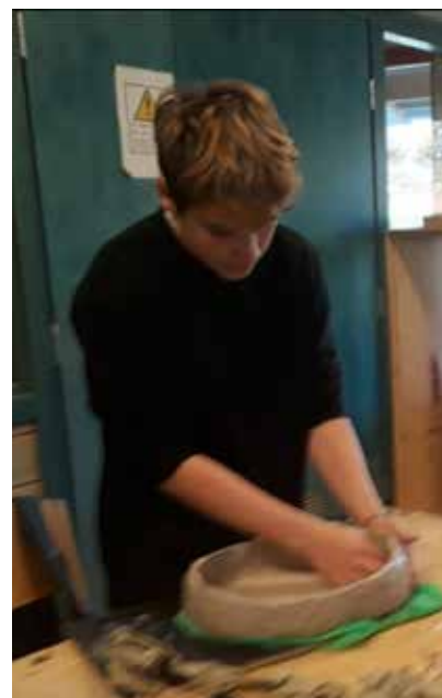
▲ 9 luokan saviastian valmistus