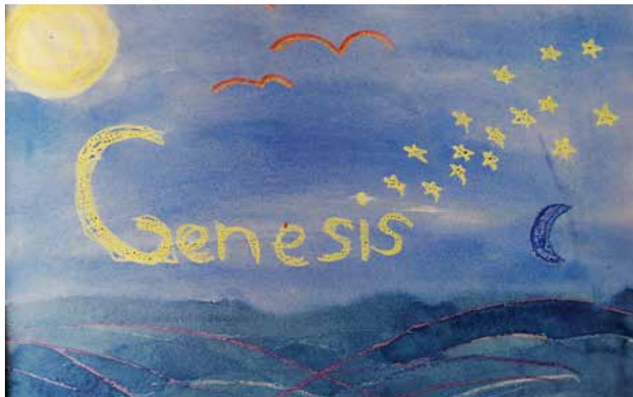
▲ Leyla 3. lk