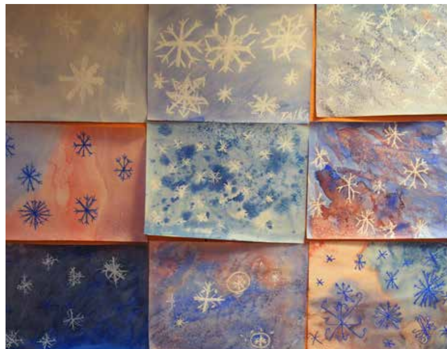
▲ 4 luokan maalauksia