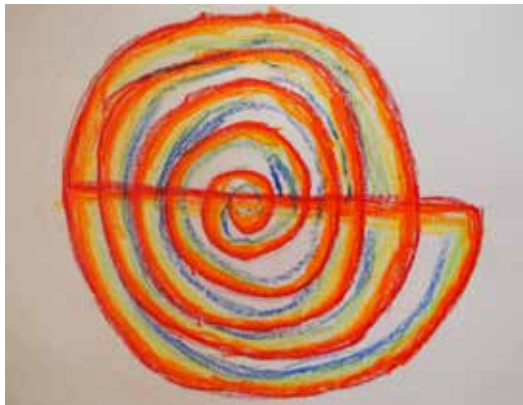
▲ Estella 4. lk

“Aikajana” oli semmoinen, että mentiin jonoon ja eka oppilas oli lapsi, toka oli isä jne.... “Leipominen” Me siis leivottiin aleksanterinleivos. Sisältö: 1dl sokeria, 4 ½ dl vehnä jauhoja, 200g margariinia, 1 muna, 1tl leivinjauhoja. Mielipide tehtävästä 5/5. - Elias