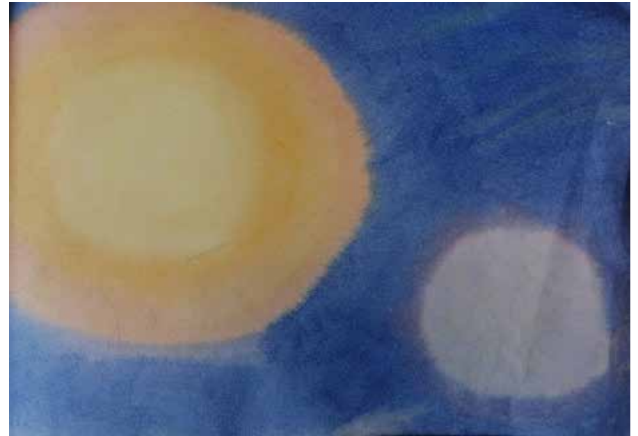
▲ Aada 3. lk