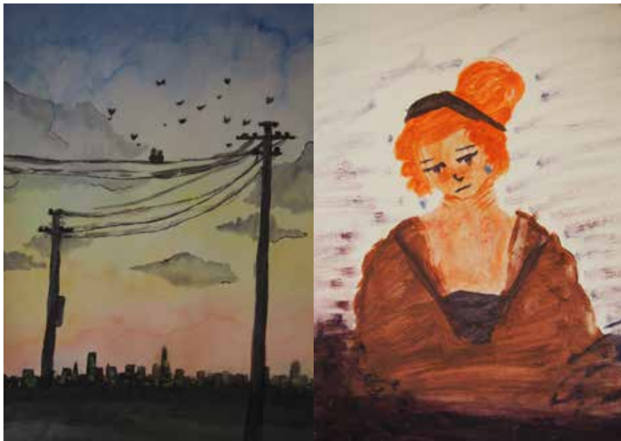
▲ Kamila lukion 1. lk.