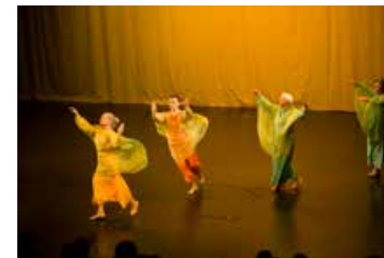
Viimeisenä esiintyi Ariel ryhmä.