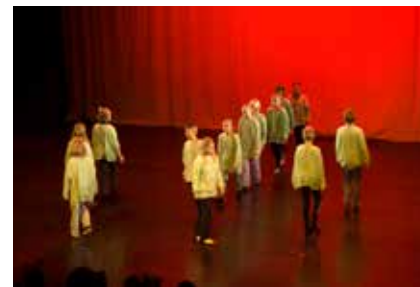
Neljäs luokka esitti kalevalaisen sävelmän ja runon.