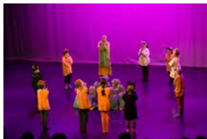
Kolmas luokka teki lavalle näyttävän kuvion ja esitti eurythmian aakkoset.