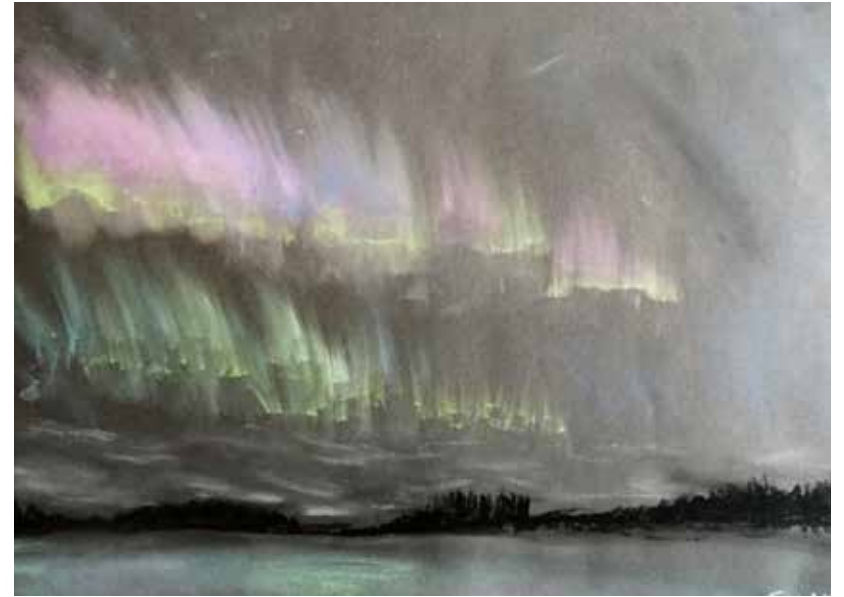
▲ 8. lk Selma