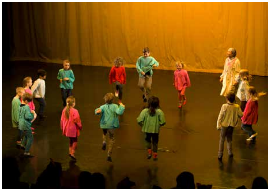
Ensimmäinen luokka saapui lavalle musiikin rytmissä askeltaen ja esitti runon Clairen näyttäessä mallia.