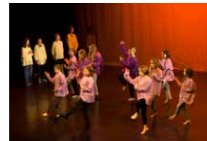
Viides luokka esitti kulttuurikausia; Intian, Persian, Egyptin ja Kreikan.