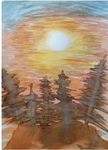
▲ 7. lk Hugo