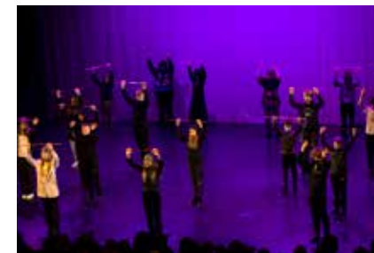
Seitsemäs luokka esitti sauhabarjoituksia ja geometrisia kuvioita.