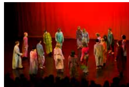
Kahdeksas luokka esitti osan Beethovenin Bagatel- lesta.