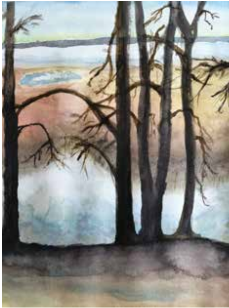
▲ 8. lk Suvi