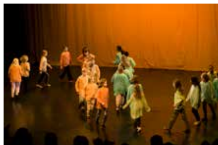
Toisen luokan esityksessä kissat ravistelivat hiiriä puusta ja popsivat niitä hiirten kipittäessä kuvioita.