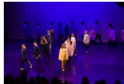
Kuudes luokka esitti osan kauniista Tsaikovskin kesäkuu sävelmästä.