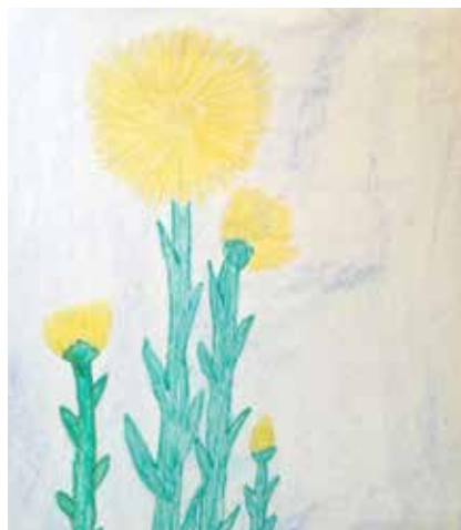
▼ Kuva: Taika 4. lk