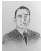
8. lk Suvin presidenttejä