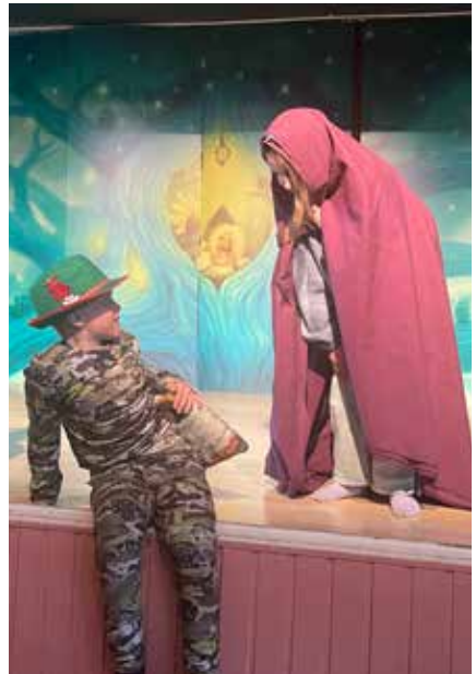
▼ Kuvat: Mervi Helenius-Talvite