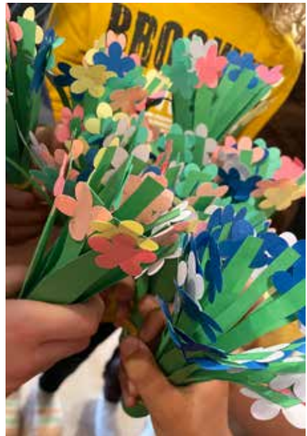
▲ Iltapäiväkerho askarteluja