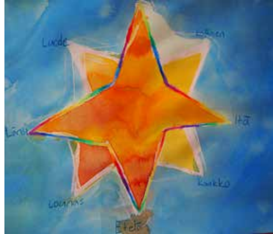
4. lk "ilmansuunnat"