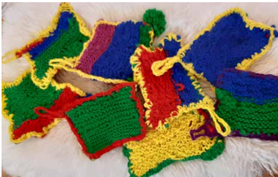
▼ Kuva Tiina Kaivola-Karvinen