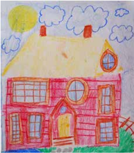
▲ 3. lk Peppi