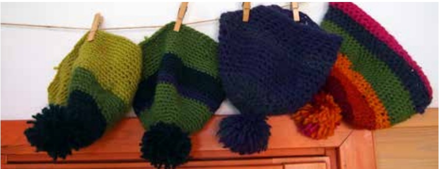
Oppilaiden virkkaamia pipoja