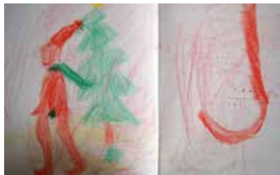
J niin kuin joulu Elsa 1.lk