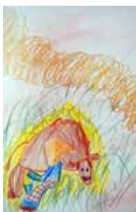
Elämää entisajalla - vihkotöitä Leo 3.lk