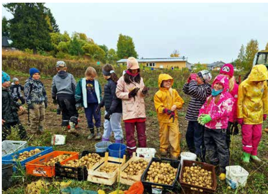
3. lk perunan nostossa