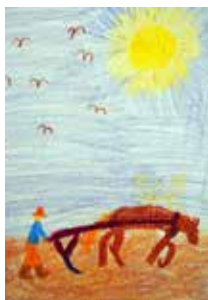
Elämää entisajalla - vihkotöitä Enia 3.lk