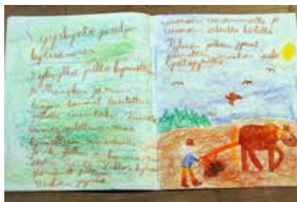
Elämää entisajalla - vihkotöitä Liina 3.lk