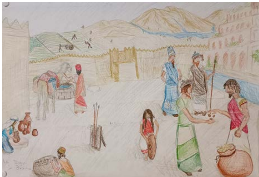
Brianna, Iida, Taiga 8. lk