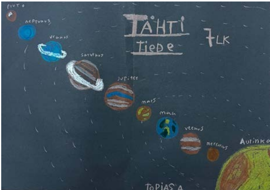
Topias, 7 lk.