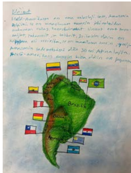
Judit, 7 lk.