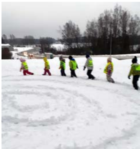
Ihanaa, lumispiraali retkiaamuna!