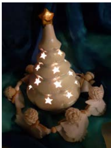
Joulun tunnelmaa eskarissa