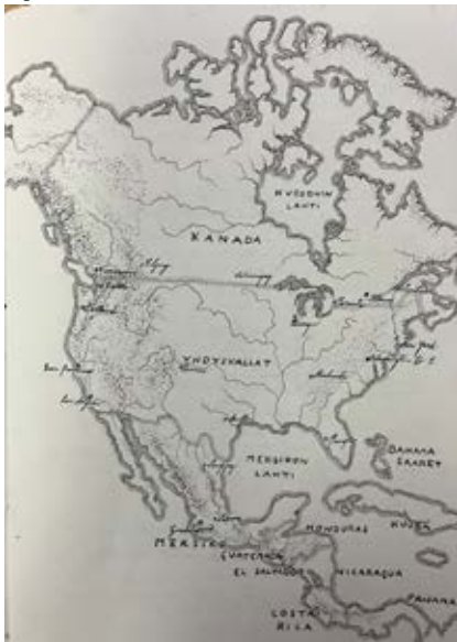
Jimi, 7 lk.