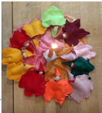
Tässä he ovat, meidän vaahteravauvat, jotka saivat nimet: Tyyne, Alicia, Alex, Pörrö, Lordi, Ruusu, Kirsikka, Pekka, Luna, Taina ja Lefa