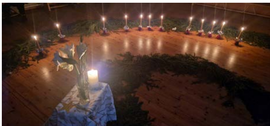
Adventijublan spiraali.