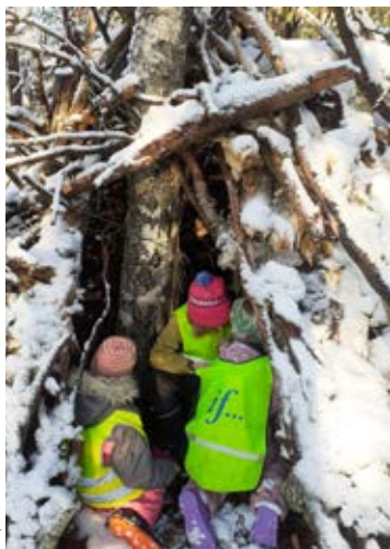
Leikkejä uudessa majassa