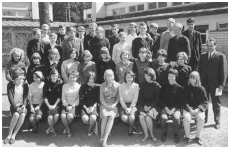
Ensimmäiset Rudolf Steiner -koulun aloittaneet oppilaat lukion lopussa