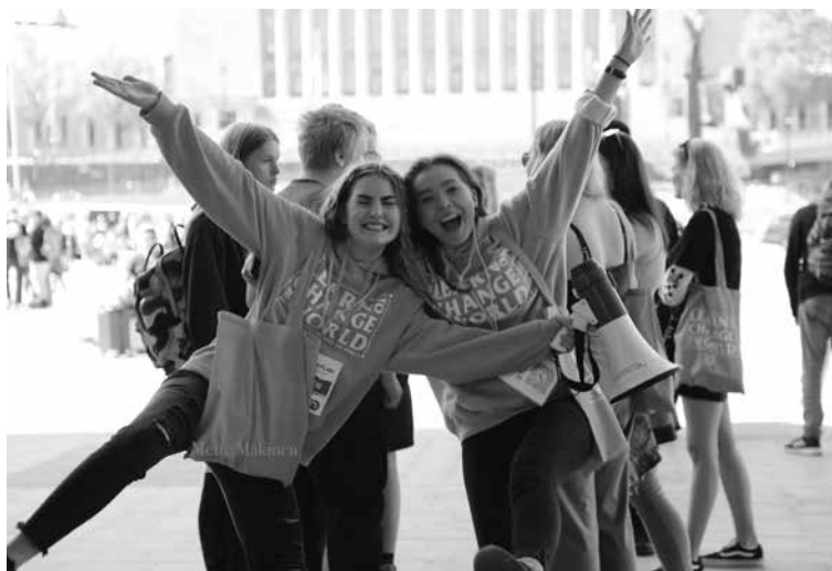
Lukiolaisia steinerkoulu 100 -juhluvuonna.