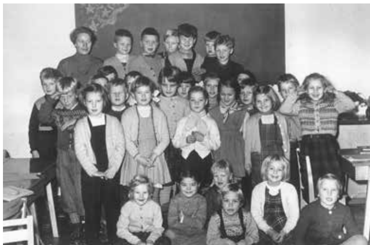
Rudolf Steiner -koulun ensimmäinen luokka 1955-1956

der oli Rake oy:n pääjohtajan puoliso ja tunsi laajalti liike-elämän johtoa. 45 Keväällä 1955 kannatusyhdistys anoi valtioneuvostolta koulun perustamislupaa. 46 Syksyllä 1955 alkoivat suomen- ja ruotsinkieliset luokat pienissä tiloissa Topeliuksenkadulla.