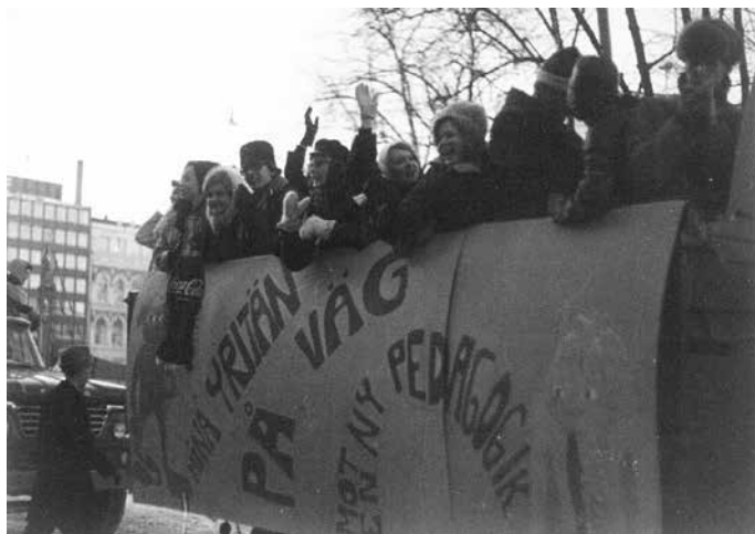
Ensimmäisten abiturienttien penkkariajelu vuonna 1968