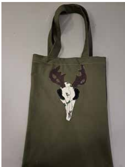
Keimo, 8. lk