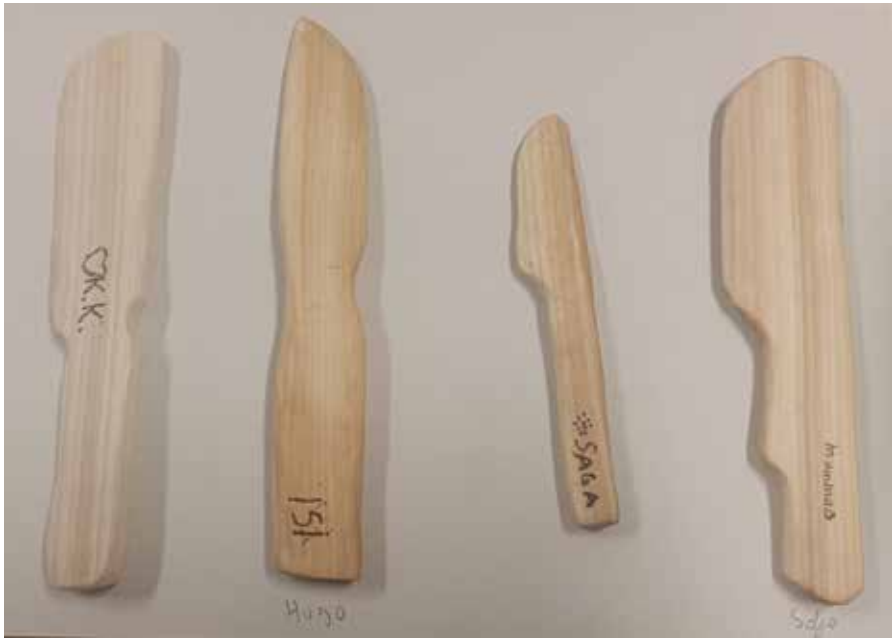
5. luokan voiveitsiä