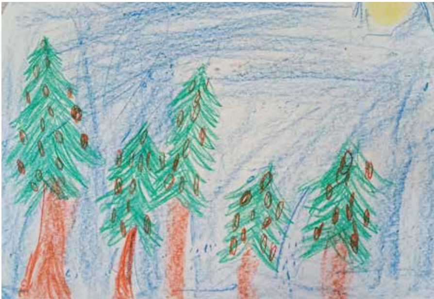
Kuva: Eine, eskikoulu

Ystävällisin terveisin Paula-ope ja eskarit