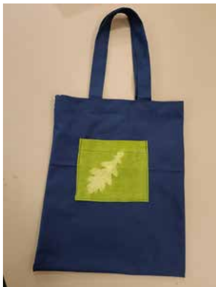
Eeli, 7. lk