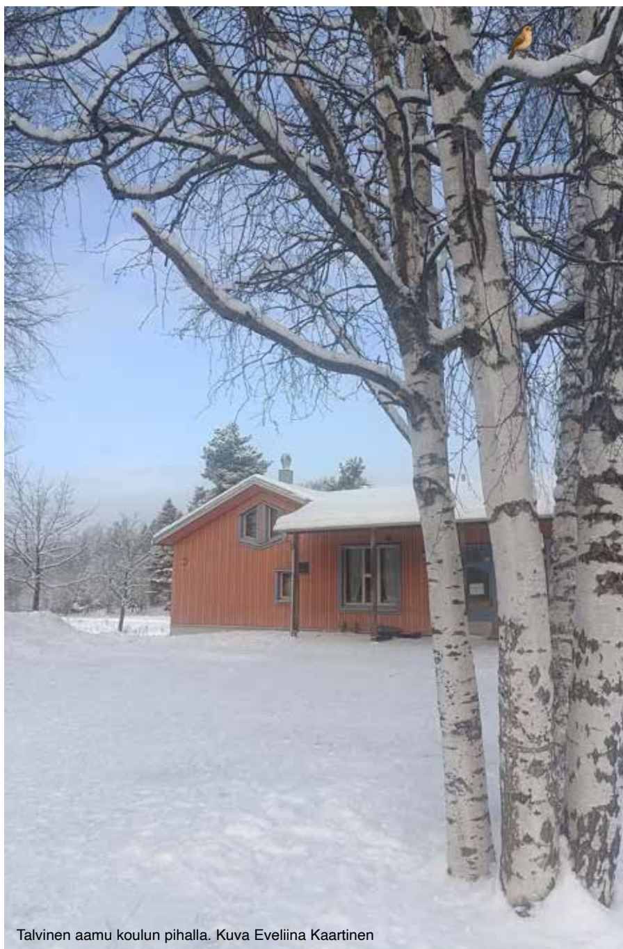
Talvinen aamu koulun pihalla.