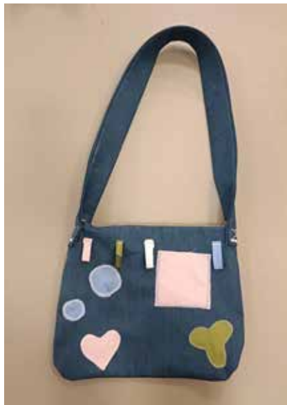
Neetu, 8. lk