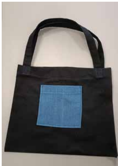
Kerttu, 7. lk